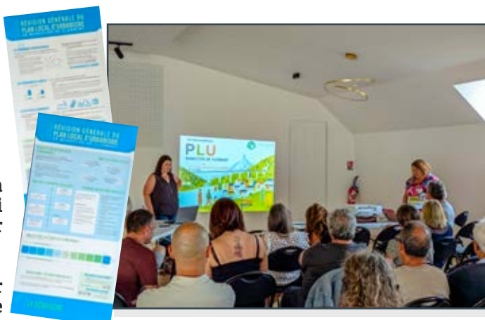
Panneaux consultables dans le hall de la mairie

Nous avons constaté que ce sujet tient à cœur de beaucoup de personnes et c'est avec calme que plusieurs points de vue ont été évoqués.